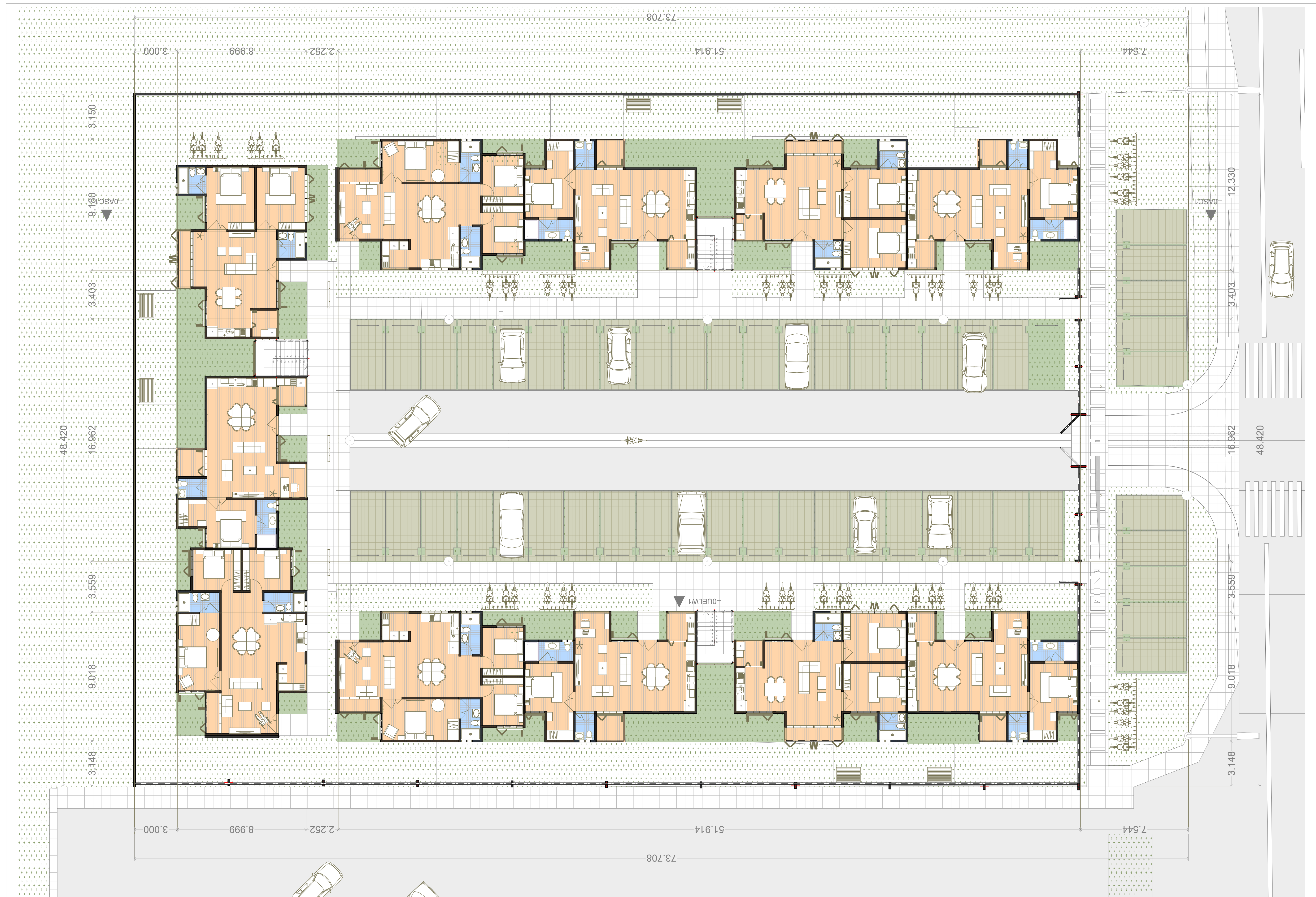
0.000UFP01 PLANTA ARQUITECTONICA PROYECTO ORANGE META NIVEL 00 ARCHITECTURE FLOOR PLAN LEVEL 00 1:125