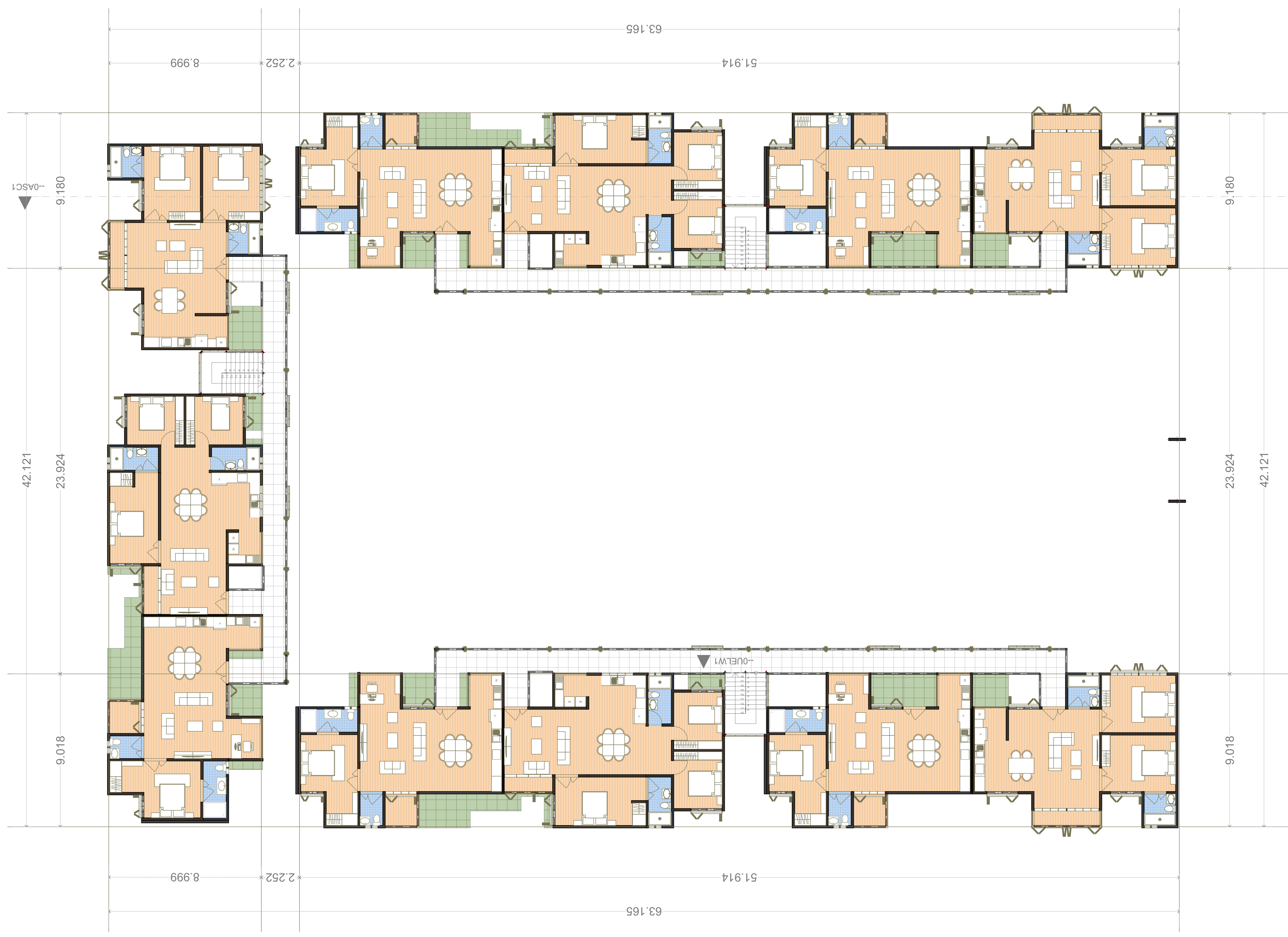
1.01 OUGP02 PLANTA ARQUITECTONICA PROYECTO ORANGE META NIVEL 01 ARCHITECTURE FLOOR PLAN LEVEL 01 1:125